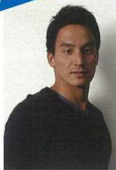
ゲスト まつだたけし 松田 文志さん

1984年6月23日生まれ、出身は宮崎県延岡市。専門種目はバタフライ、自由形で、2008年北京オリンピック、2012年のロンドンオリンピックとも、「男子200mバタフライ」で銅メダルを獲得するなど、幅広く活躍されています。